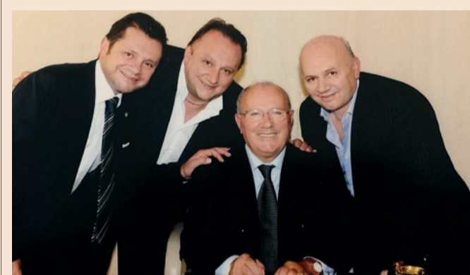
La famiglia Sanguedolce